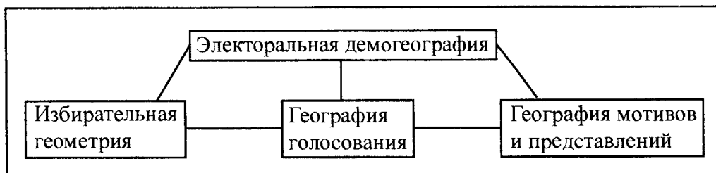
Рис. 3. Функциональная (субъектная) модель украинской электоральной географии (составлено автором)