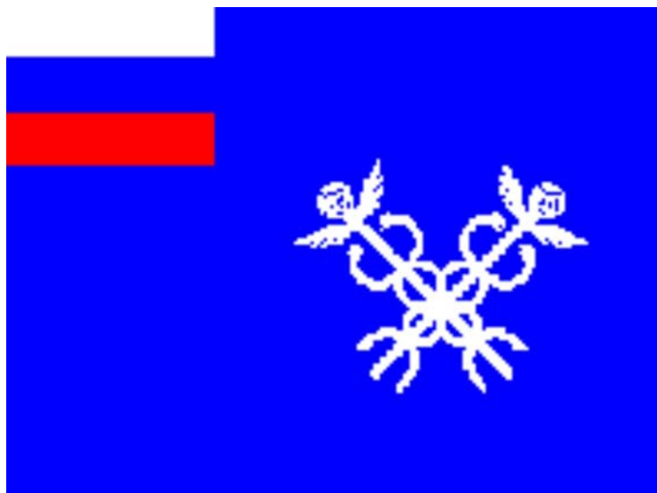
Рис. 3. Императорский флаг Российской таможенной службы

Именно шпиль на круглой башне здания нес на себе до революции флаг Российского морского таможенного ведомства, который был утвержден 1 марта 1871 года – синее полотнище с национальным триколором в кантоне и скрещенными кадучеями (жезлами Меркурия), обвитыми змеями (см. рис. 3).