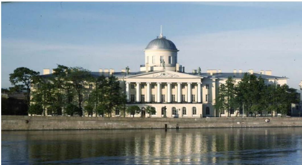
Рис. 2. Здание главной Морской таможни в Санкт-Петербурге

Трехэтажное здание Морской таможни венчается круглой башней, которая по высоте совсем немного уступает своей архитектурной основе и одиноко возвышается над всей округой. На куполе башни установлен шпиль, длина которого в свою очередь равна этажу основного здания (см. рис. 2).