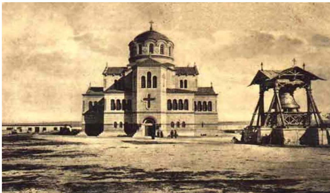
Рис. 4. Херсонесский собор на дореволюционной открытке

Визуально (и это во-вторых) образ поэта совершенно точен. Свято-Владимирский собор спроектировали таким образом, что издали он выглядит как многоглавый храм. Многочисленные части его покрытия (от купола до фрагментов крыши), разной формы (круглые, угловые, квадратные), но при этом в тот период одного цвета, и впрямь смотрятся как отдельные «главы». Разрастаясь вширь, они ниспадают тремя ярусами – от вершины к основанию (см. рис. 4).